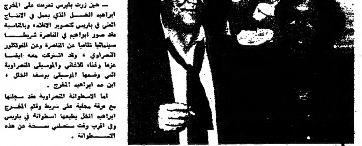
المطربان يوسف مطر وفهد بلان في لقاءهما في لندن